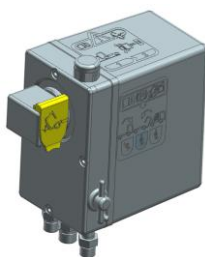
Imagem 1 – Vista 3D